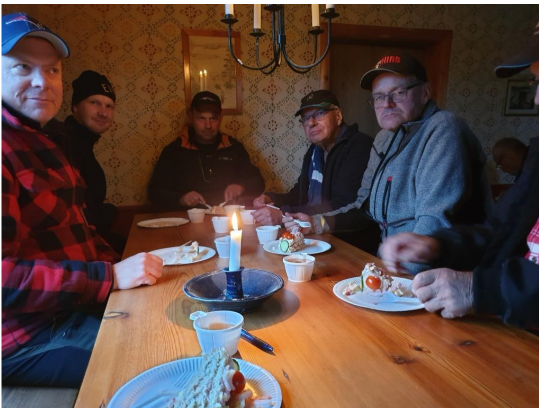
2021-09-28: Uppstartsmöte i Lassas vallstuga.