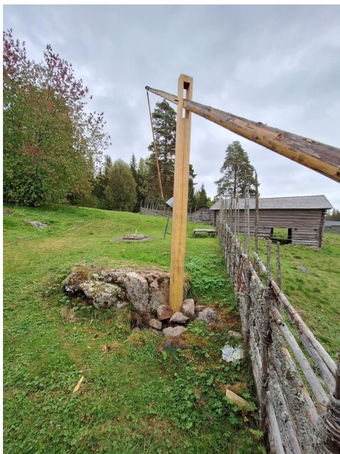
2023-09-15: Nyttillverkat "vinnandon" på Hagas vallruta.