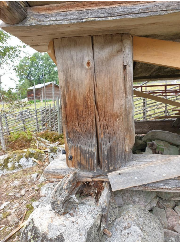
2022-09-09: Det var rötskador i den bakre syllramens ena hörn.