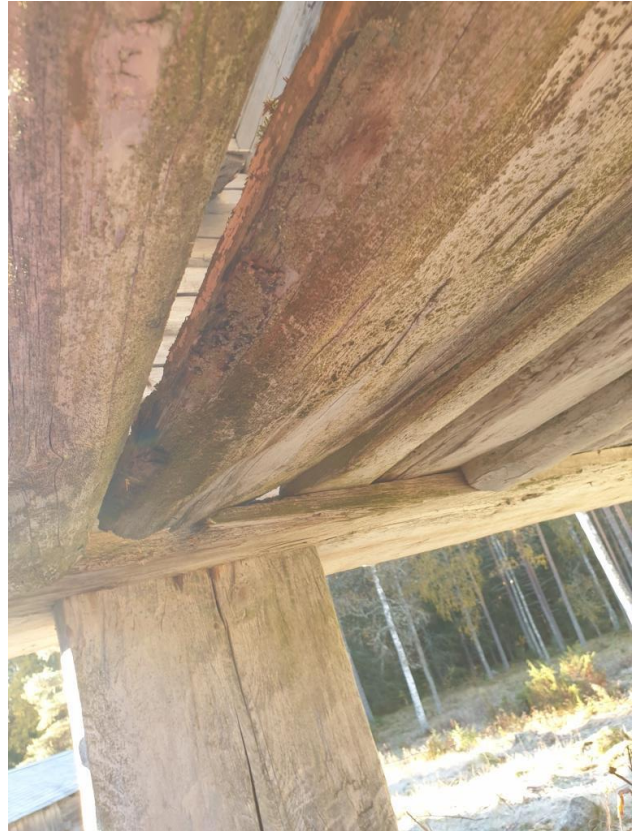
2022-10-04: Den yttre brädan var skadad, medan den inre skulle undersökas närmare innan ev. byte.