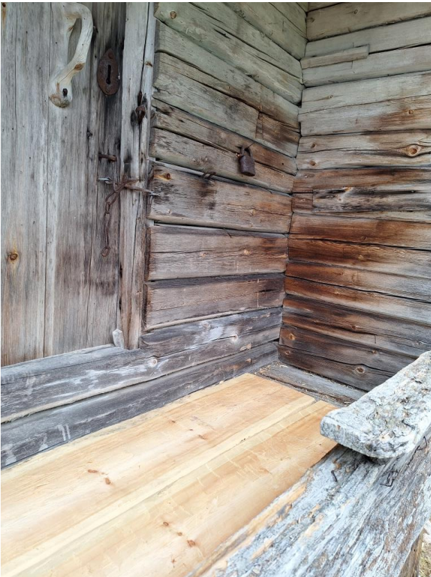
2023-09-15: De tidigare klivbrädorna har ersatts av två nyttillverkade som kluvits fram ur stock och bilats.