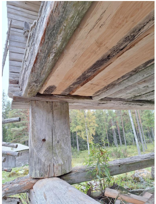
2023-09-15: Klivbrädorna är av furu, lika som de som låg där tidigare.