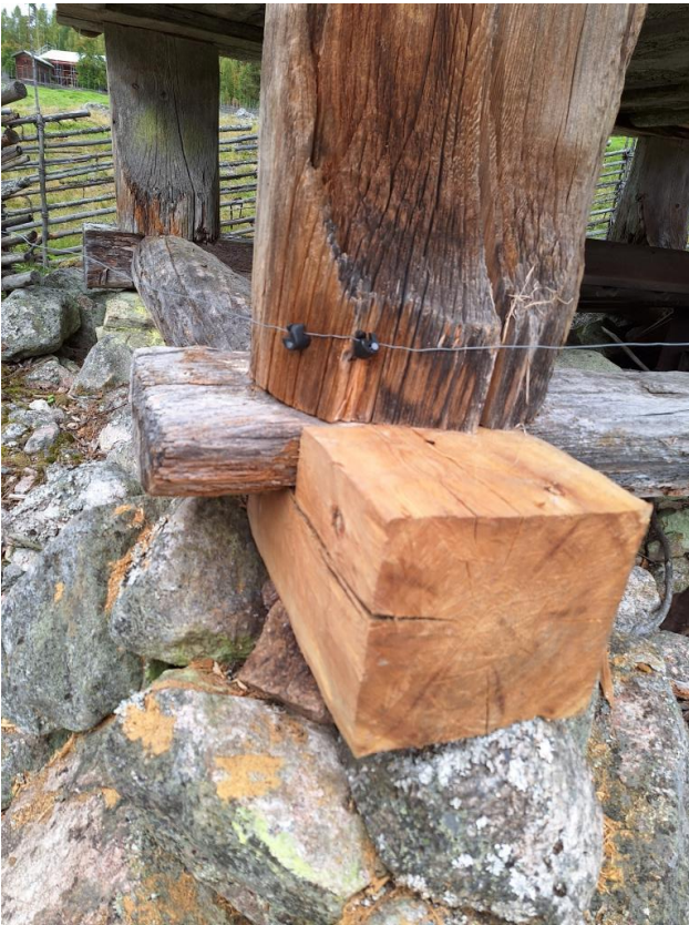
2023-09-15: Underredet har lagats och fått en ny knutskalle.