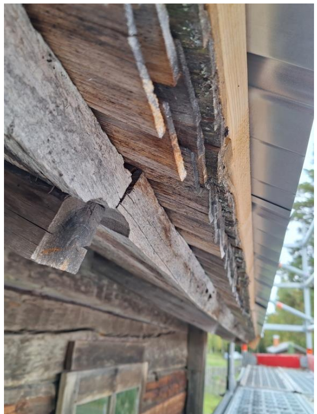
2023-09-15: Plåten har släppts ut ordentligt så att en droppnäså bildas. Några hängbrädor monterades inte, utan hela takupbyggnaden lämnas öppen och synlig.