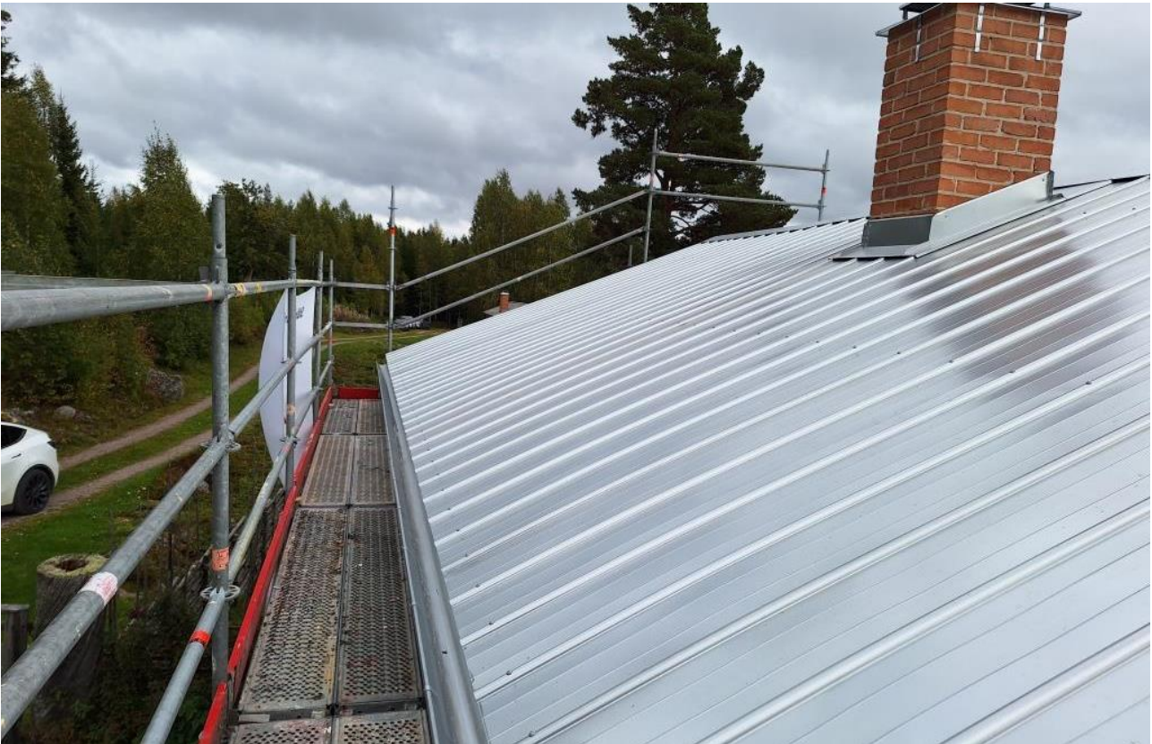
2023-09-15: En ny hänggränna monterades längs hela baksidans takfall, lika som tidigare. Nya skorstensbeslag monterades.