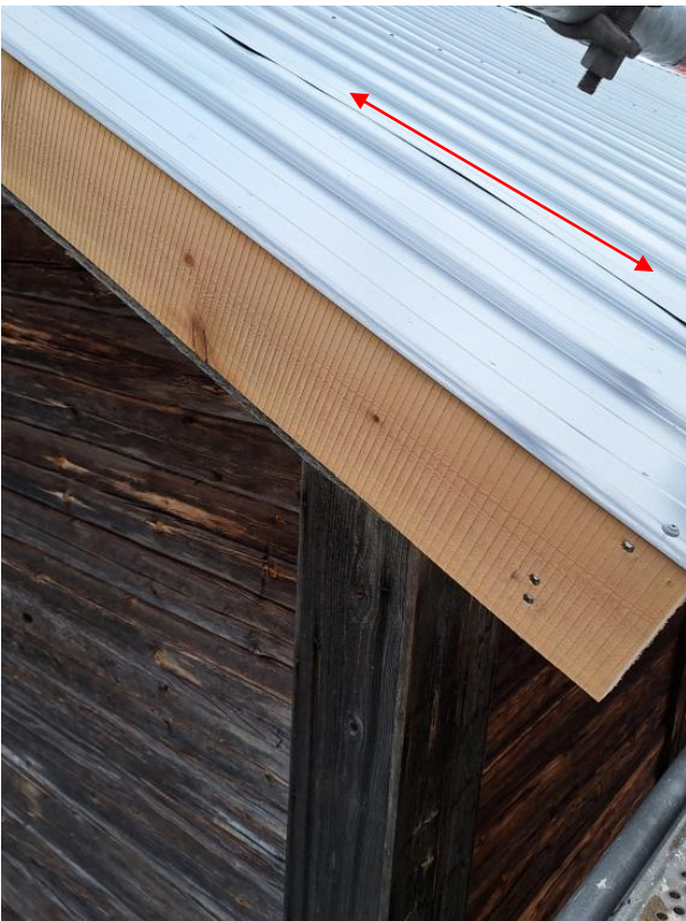
2023-09-15: För att passa utskäftet på gaveln klipps plåten, och kanten viks upp under rillan så att vatten inte ska kunna rinna in trots den vertikala skarven (röd pil).