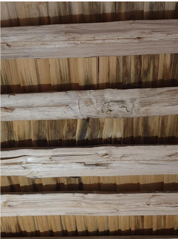
2022-10-13: Splintveden har sugit i sig vatten, och spånen har mörknat av begynnande röta.