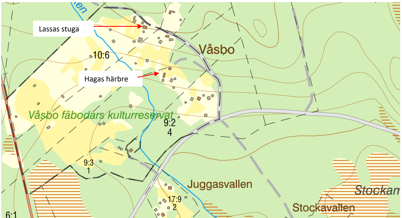
Karta över Våsbo fäbodas kulturresevat med de aktuella objekten markerade.

Genomförda åtgärder – Lassas vallstuga Västra Roteberg 10:6 s. 13