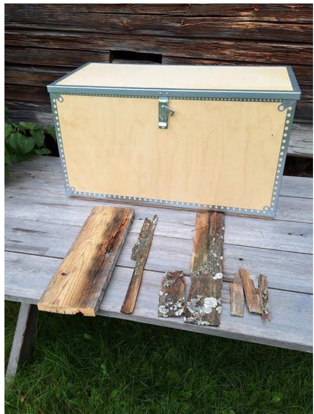
2023-09-15: I arkivlådan har delar från takomläggningen sparats.