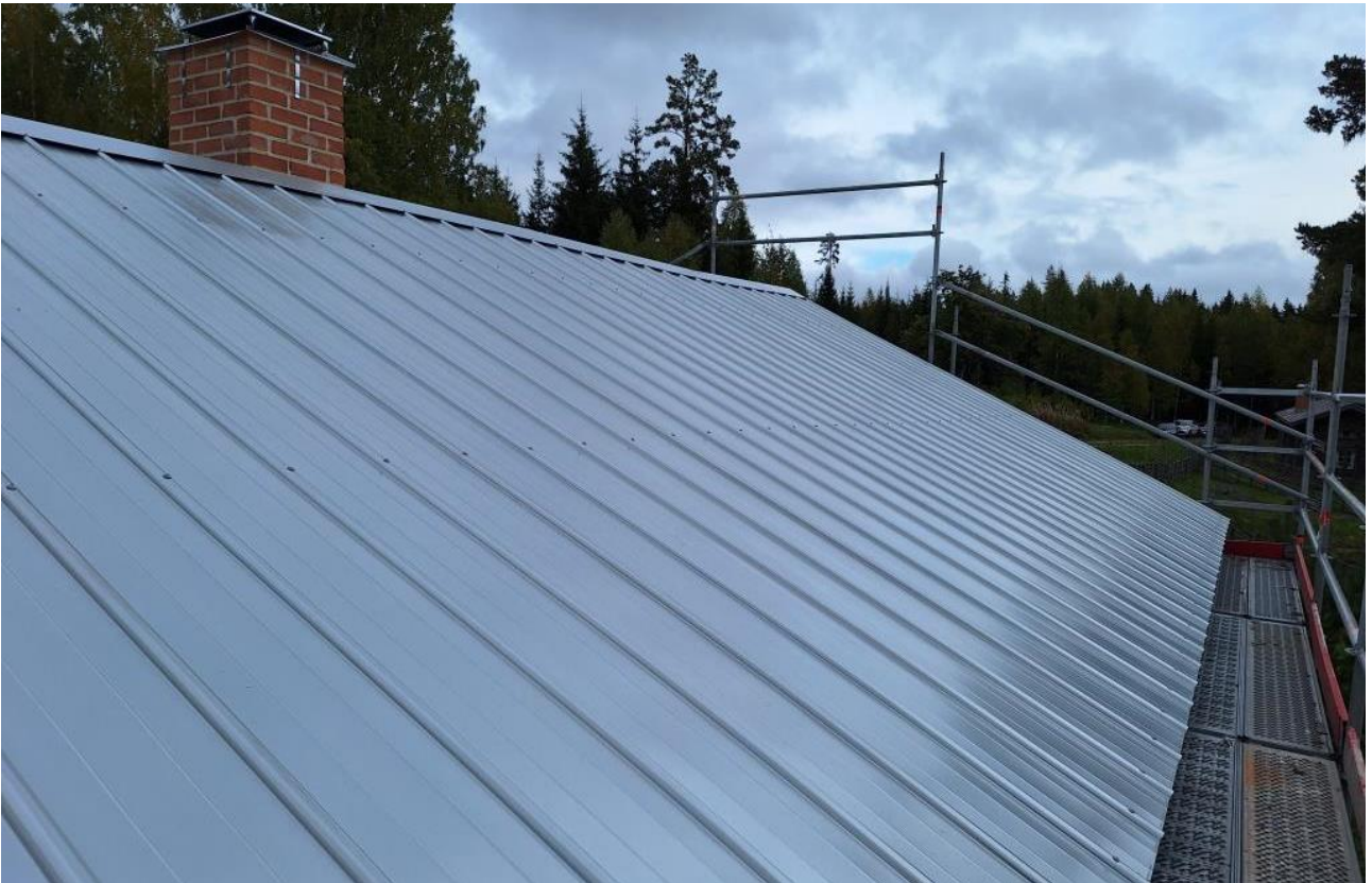
2023-09-15: Södra takfallets pannplåt.