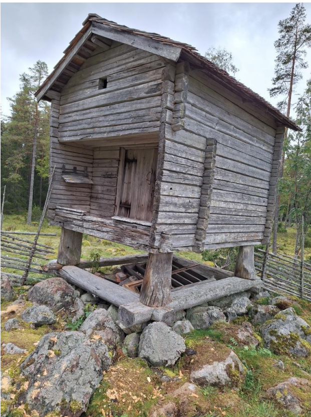
2023-09-15: Grunden har justerats under hörnet.