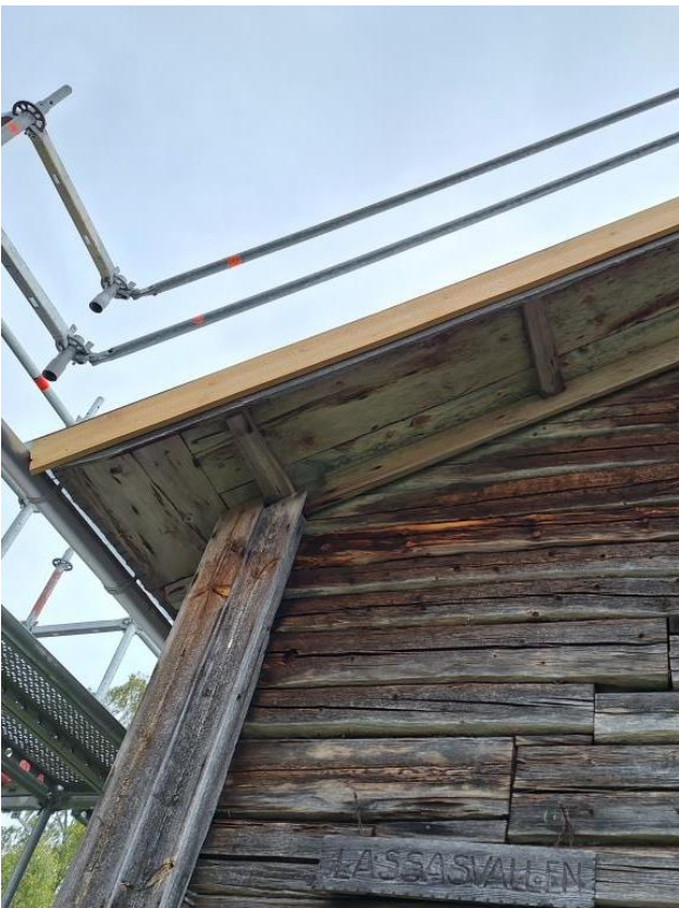
2023-09-15: Takfallen var ur vinkel med någon dryg decimeter så plåtarna fick anpassas för att inte sticka ut i gavelutskäftet.