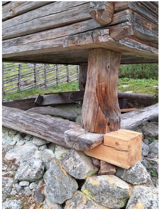
2023-09-15: Återstoden av underredets stock är bevarad.