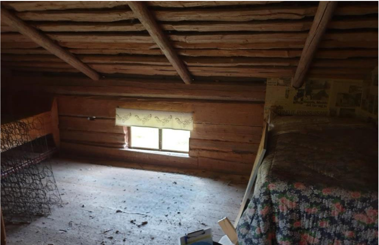
2022-10-13: Lassas vallstuga har en vind som delvis är inredd och delvis är öppen utan skivtäckning. I den öppna delen syntes rötskador i takspånet från 2003.