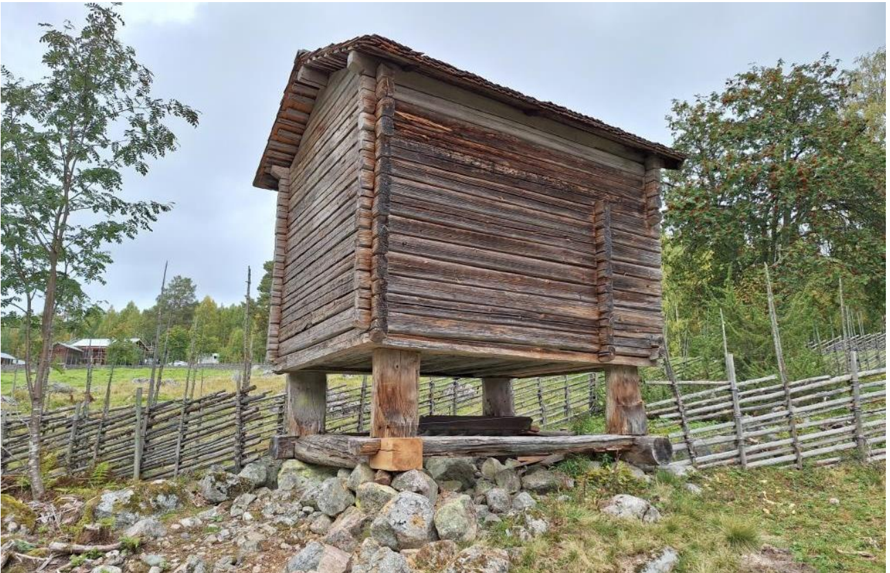
2023-09-15: Härbret på Hagas vall efter lagning av skada och justering av stengrunden.