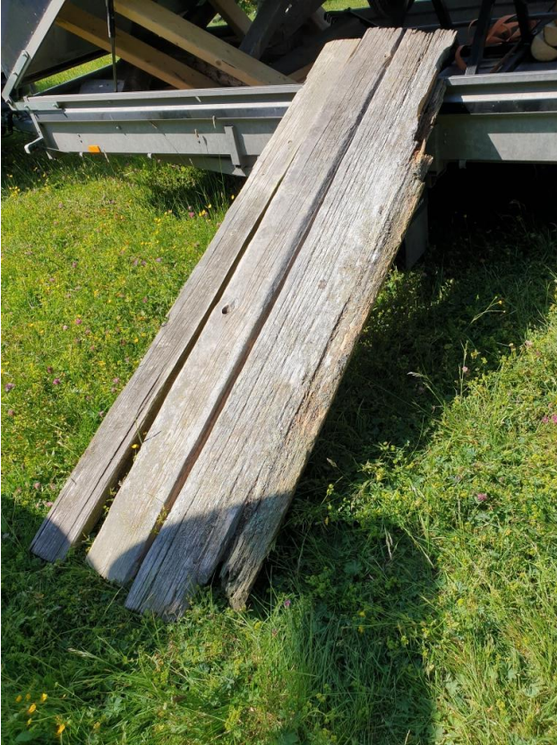
2023-06-16: Inför en klyvningsworkshop togs de gamla klivbrädor fram.