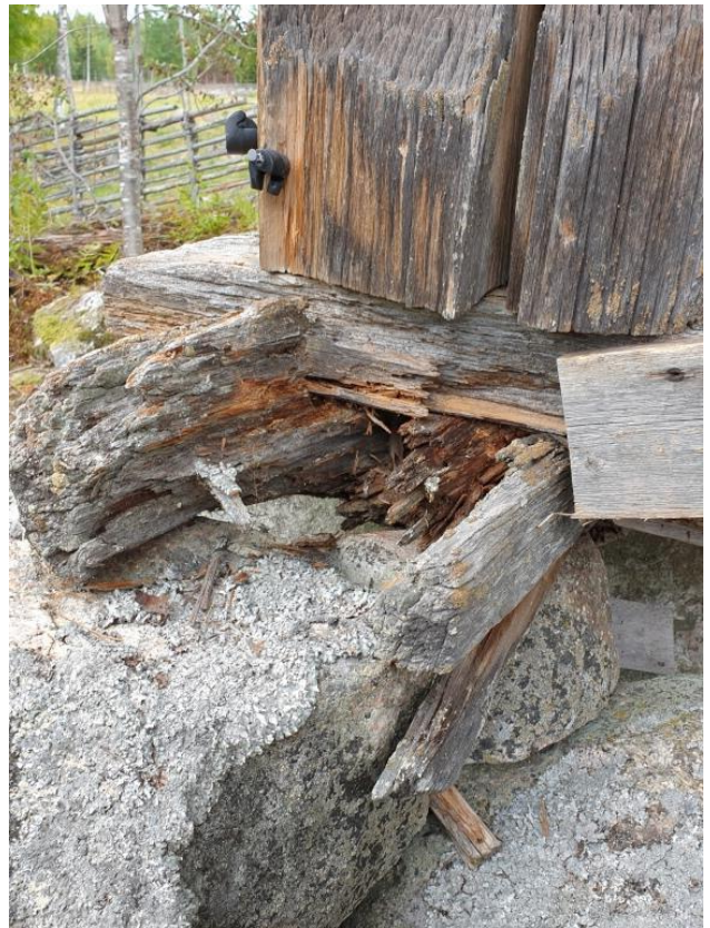
2022-09-09: Rötskadan gör att timret pressas samman.