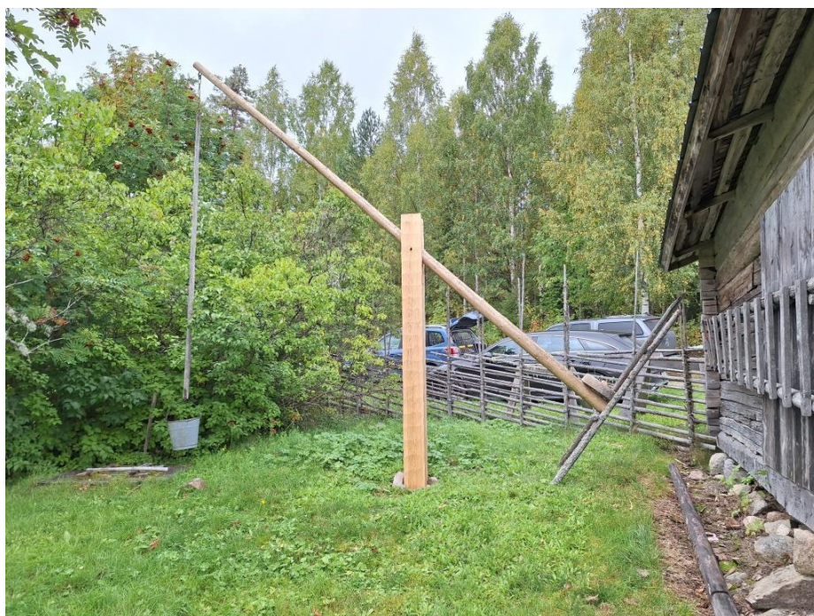
2023-09-15: Nyttillverkat "vinnandon" på Lassas vallruta.