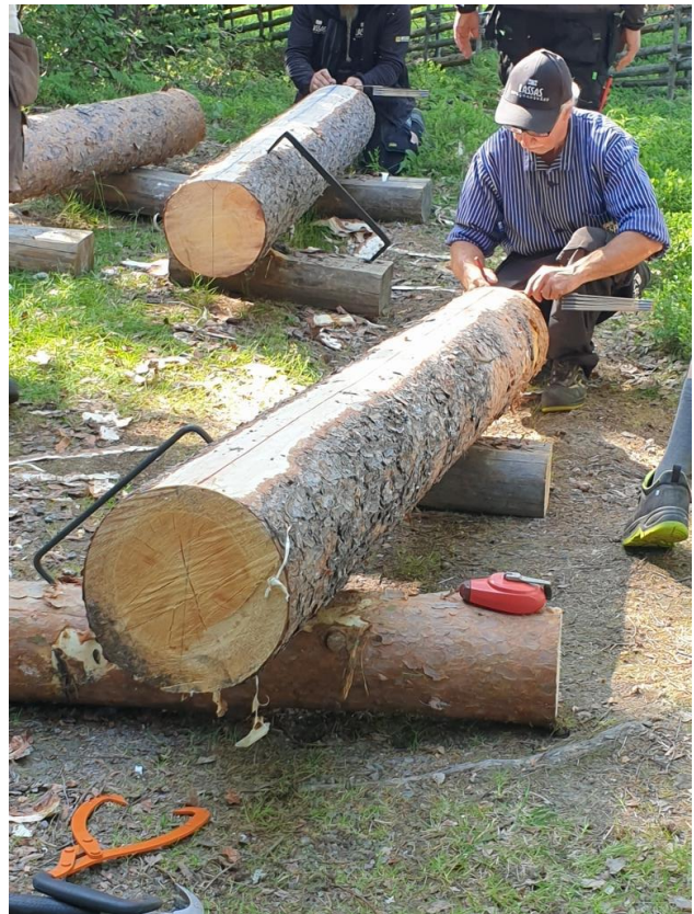
Förberedelserna omfattar att läsa virket, vrida det rätt inför klyvningen och förbereda innan klyvningen.