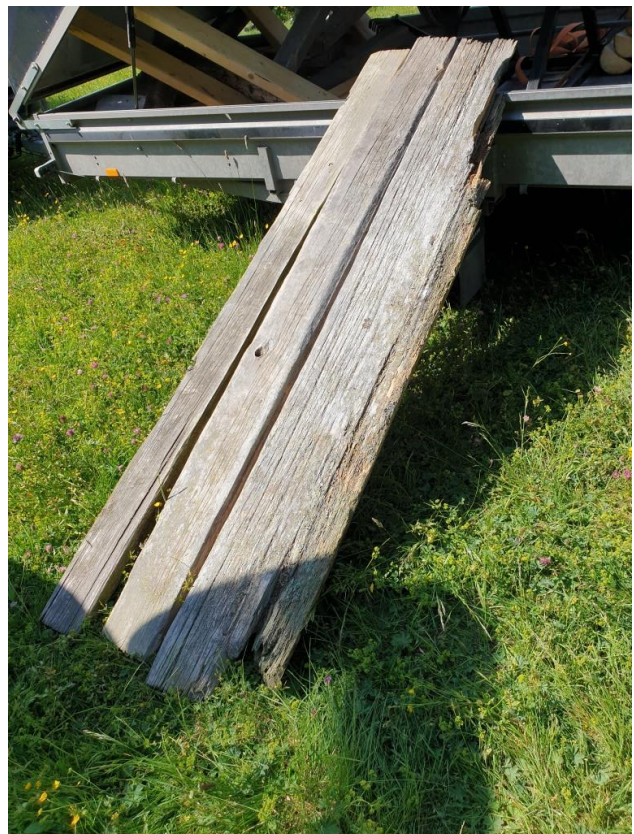
Originalbrädorna plankorna från Hagas härbre användes som förebild när nya höggs fram.