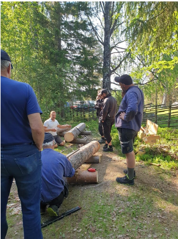
Tre av de fyra vallarna fanns representerade under workshopen, förstärkta av anställda på Lassas byggnadsvård.