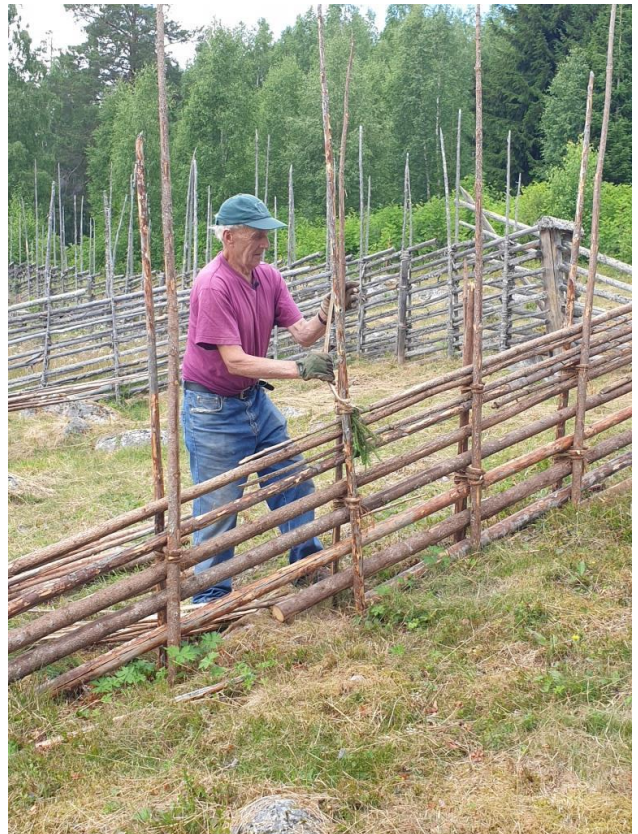
2023-07-05: Denna del av hagen stängdes senast om 2012 i samband med invigningen av kulturreseptatet.