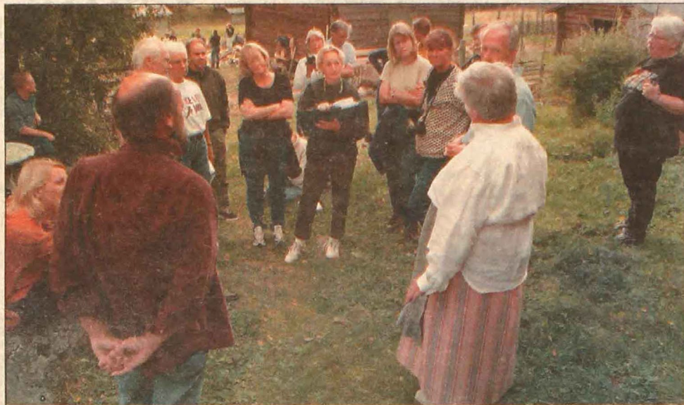
BEVARA FÄBODARNA. För att se hur olika fäbodmiljöer kan variera besökte folk från länsstyrelsen, länsmuseet och lokala museer i Gävleborg olika fäboddar på torsdagen. Bland annat gjorde de ett stopp vid Våsbo fäboddar.