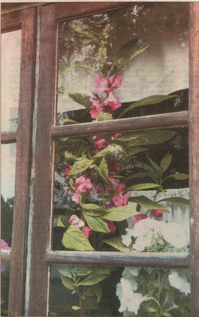
Fönstren i fäbodstugan på Skomakra-vallen har färgklickar av balsaminer, petunier och pelargoner.