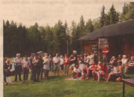
Mycket folk hade samlats på gårdstunet vid Ololssvallen på fredagen, där invigningen började.