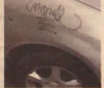
Inger Hjalmarssons bil har "taggats" av en klottrare.