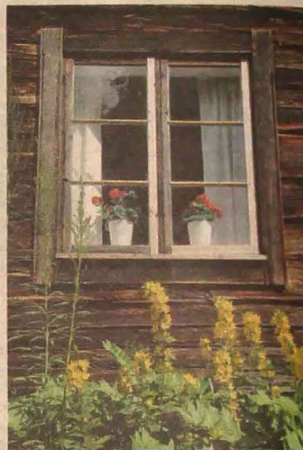
Bara fönstren på fäbodstugorna är en härlig sommarupplevelse.