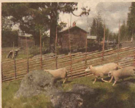
Vid Väsbo fäbod nordväst om Edsbyn finns även i dag får och kor i några hagar. Så sent som 2004 upphörde det sista av den traditionella fäboddriften vid fäboden.