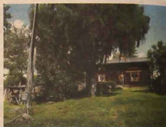
Skomakravallen vid Väsbo fäbod.